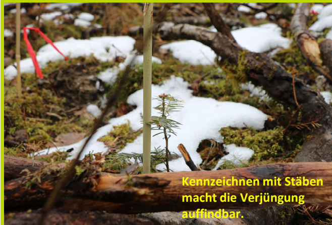
Kennzeichnen mit St äben macht die Verjüngung auffindbar.

Die B äumchen gibt's bei ein bisschen Pflege von der Natur geschenkt!