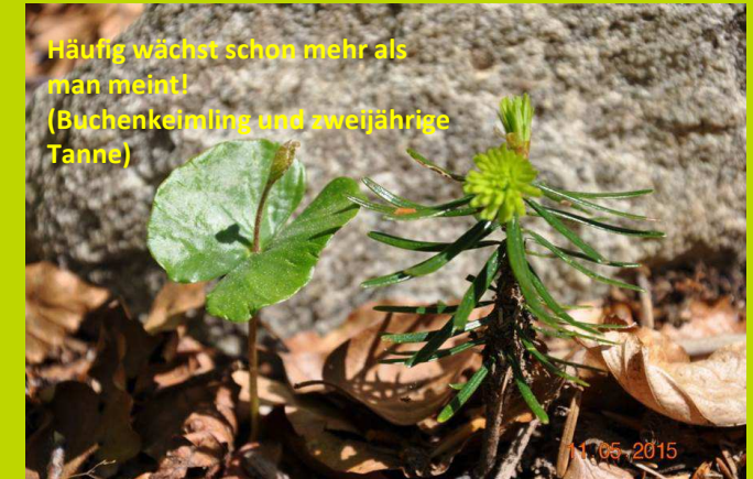
H äufig w ächst schon mehr als man meint! (Buchenkeimling und zweij ährige Tanne)

Sie bauen heute an der (Wald)Zukunft Ihrer Enkelkinder!